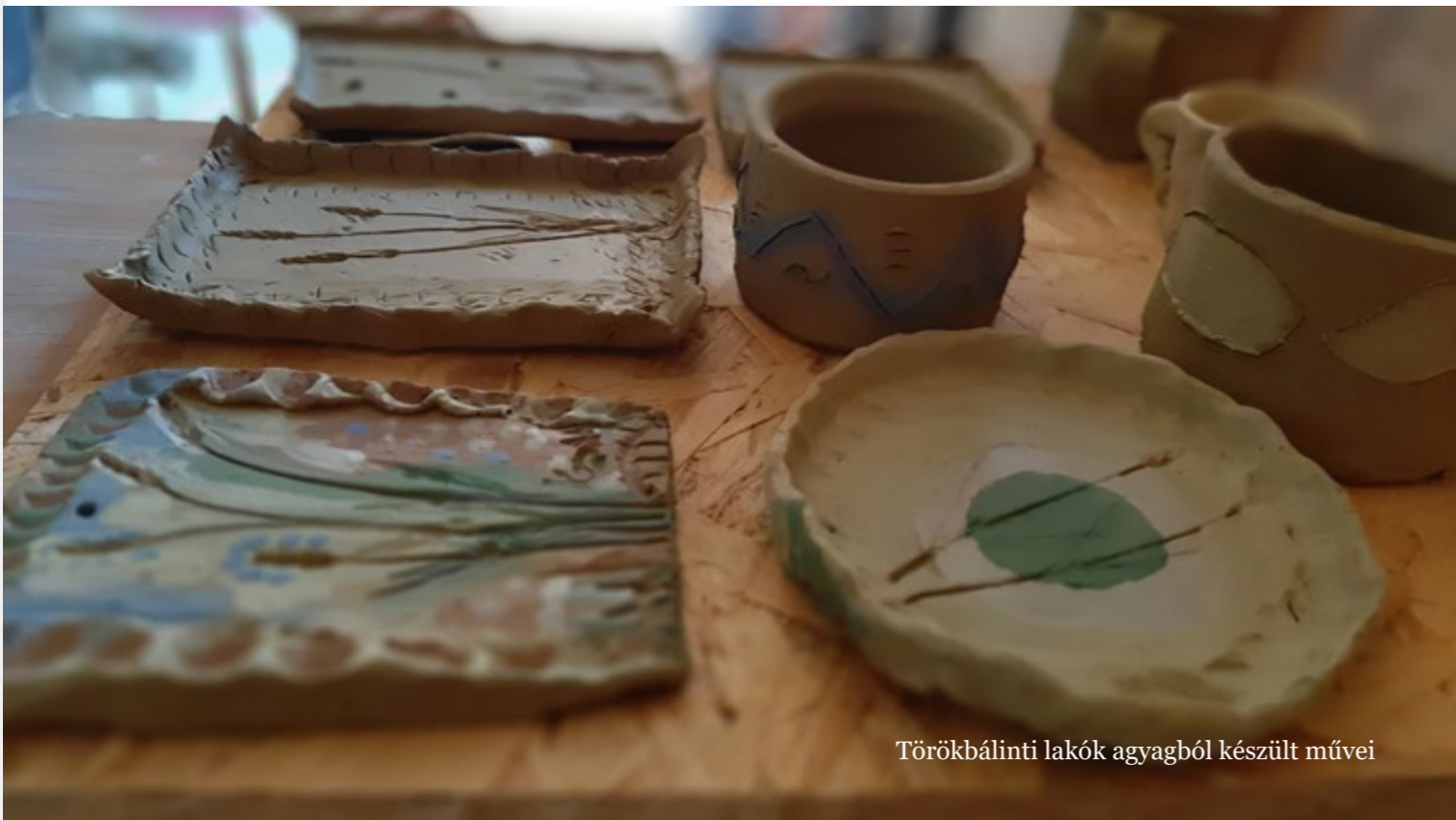
Törökbálinti lakók agyagból készült művei

Márciusi lapszámunkban a programszervezés és az Olajág Magazin kapcsán tettünk fel Önöknek néhány kérdést.