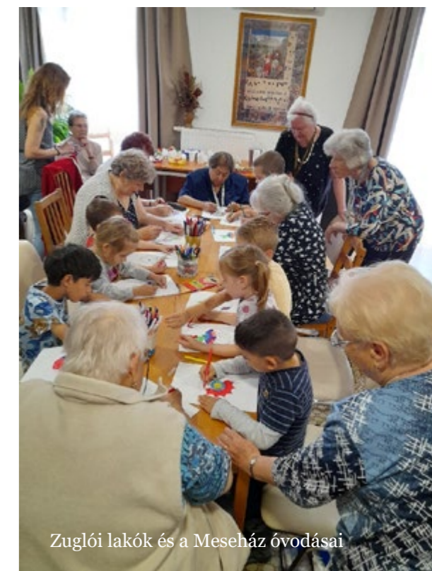
Zuglói lakók és a Meseház óvodásai