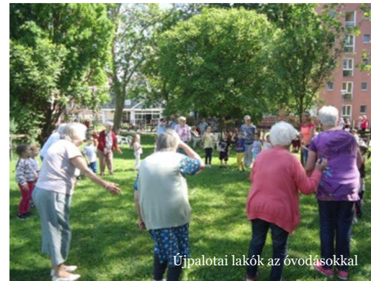
Újpalotai lakók az óvodásokkal

A Micimackó Óvoda Bagoly csoportját hívtuk meg hozzánk gyereknapi. Finom gyümölcstállal, isteni limonádéval vártuk őket. Volt bőven görögdinnye, alma, uborka, répa, szőlő. Jókat beszélgettünk a cserfes kisgyerekekkel. Aztán „kreatívkodtunk” egy kicsit: színes papírvirágot készítettünk velük néhány lelkes lakónk közreműködésével. Nagy sikere volt a célbadobós játéknak, majd közösen játszottunk, mozogtunk egyet. Mi is és ők is nagyon jól szórakoztunk. Sokáig integettünk nekik, amikor indultak vissza az oviba. Szeptemberben újra találkozunk!