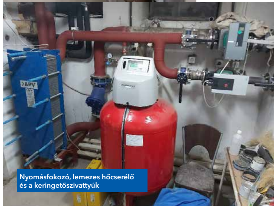
Nyomásfokozó, lemezes hőcserélő és a keringetőszivattyú

A termelt hő elosztása a meglévő struktúrában, de minőségileg és mennyiségileg szabályozottan valósul meg az új rendszerben, fűtési üzemmó-