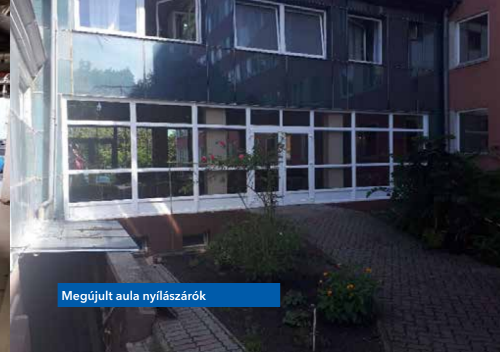
Megújult aula nyílászárók