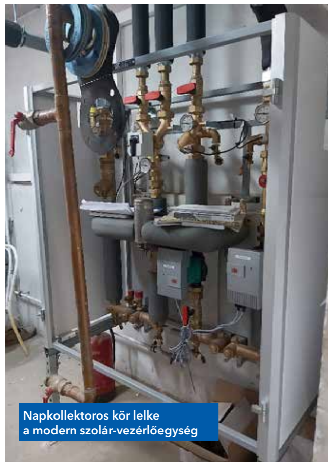
Napkollektoros kör lelke a modern szolár-vezérlőegység

kazánházában az épület és konyha részére önálló, új hmv termelő berendezések kerület kialakításra 100-200 kW teljesítménnyel és 1-2 m 3 tároló kapacitással jellemzett tároló-töltő rendszerben, hőcserélővel, szivattyúval, szerelvényekkel, hmv tárolóval.