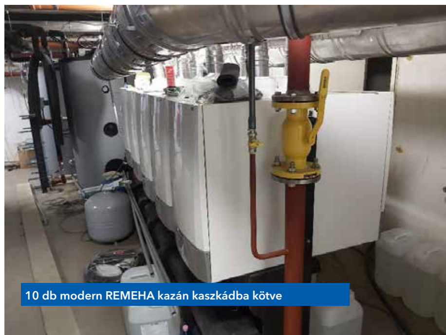
10 db modern REMEHA kazán kaszkádba kötve