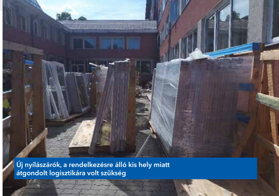
Új nyílászárók, a rendelkezésre álló kis hely miatt átgondolt logisztikára volt szükség