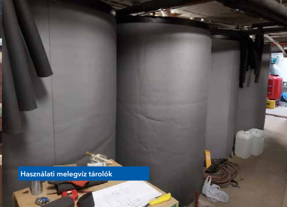
Használati melegvíz tárolók