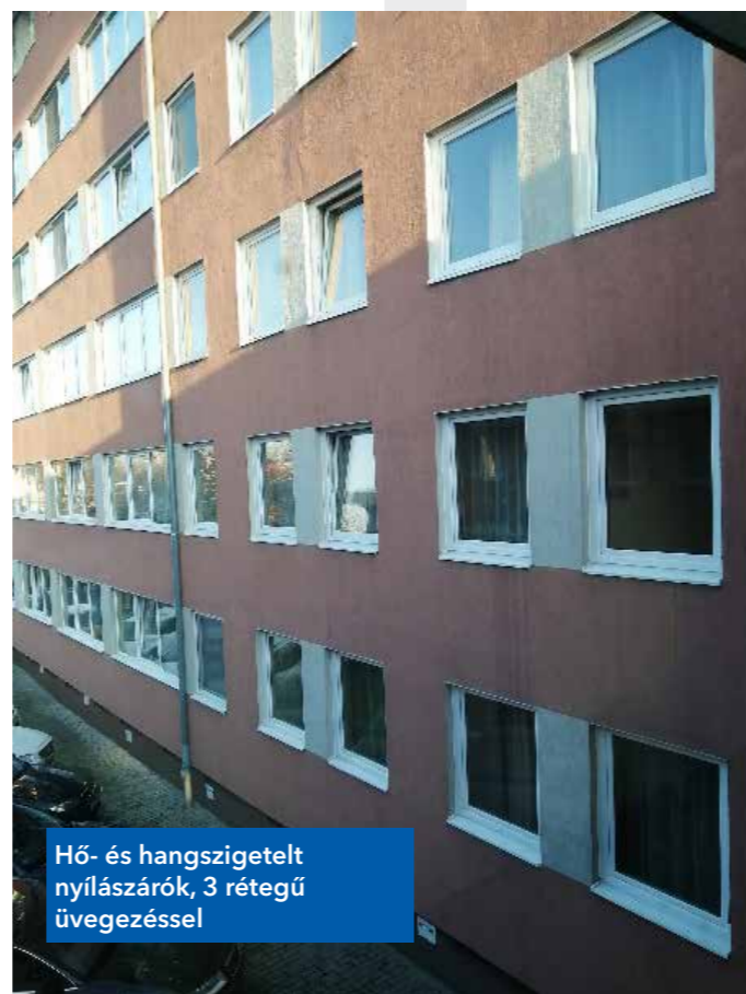
Hő- és hangszigetelt nyílászárók, 3 rétegű üvegezéssel

kat a hulladék konténerekbe helyezni. Az új, modern nyílászárók anyagukat tekintve műanyagok, üvegezésüket tekintve 3 rétegűek ( U_g=0.7W/m^2K ). A beépítésre kerülő ablakok hőátbocsátási tényezője legalább U_f=1,1 W/m^2K értékkel rendelkezik. A nyílászárók cseréjekor új párkányok és könyöklők kerültek elhelyezésre, továbbá belülről műanyag takarók kerültek beépítésre, melyek idomulnak az új ablakokhoz. Cserére kerültek a földszinti aula elavult, rossz szigetelési képességgel bíró, előregeedett nyílászárói is. A nyílászárócseréje összesen 774 db nyílászáró cseréjét jelentette.