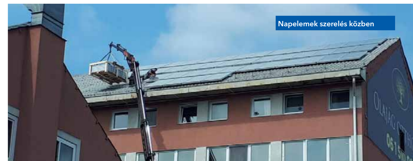
Napelemek szerelés közben

A hőtermelő rendszerhez kapcsolódó égéstermék-elvezető rendszer kialakítása homlokzati vagy más külső építési engedélyköteles átala-