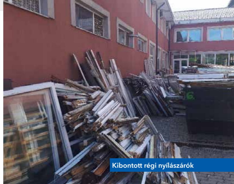
Kibontott régi nyílászárók

ban 60/40°C, hmv termelő üzemmódban 70/50°C névleges hőmérsékletszinten. A hőtermelő rendszerből fűtési üzemmódban időjárás követő menetrend szerint történik a hő